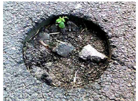
na ul. Warmińskiej