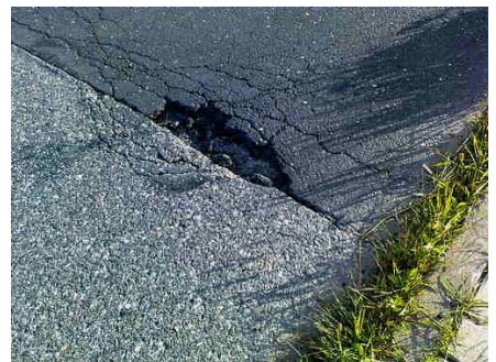
Okolice mostku na ul. Żernickiej