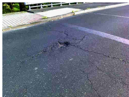
Okolice mostku na ul. Żernickiej