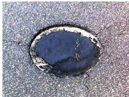
na ul. Warmińskiej