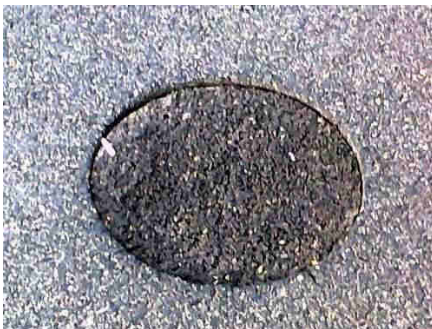
na ul. Warmińskiej

Zwracamy się z uprzejmą prośbą o dokonanie bieżącego remontu nawierzchni wymienionych powyżej ulic. Jak widać na załączonych poniżej fotografiach, w ich nawierzchni jest mnóstwo ubytków i spękań, które w nadchodzącym sezonie zimowym, na skutek penetracji przez wodę i działanie niskiej temperatury, spowodują jeszcze większą degradację ich nawierzchni.