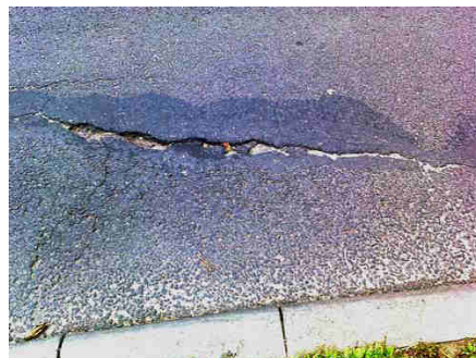
na ul. Warmińskiej