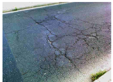
Okolice mostku na ul. Żernickiej