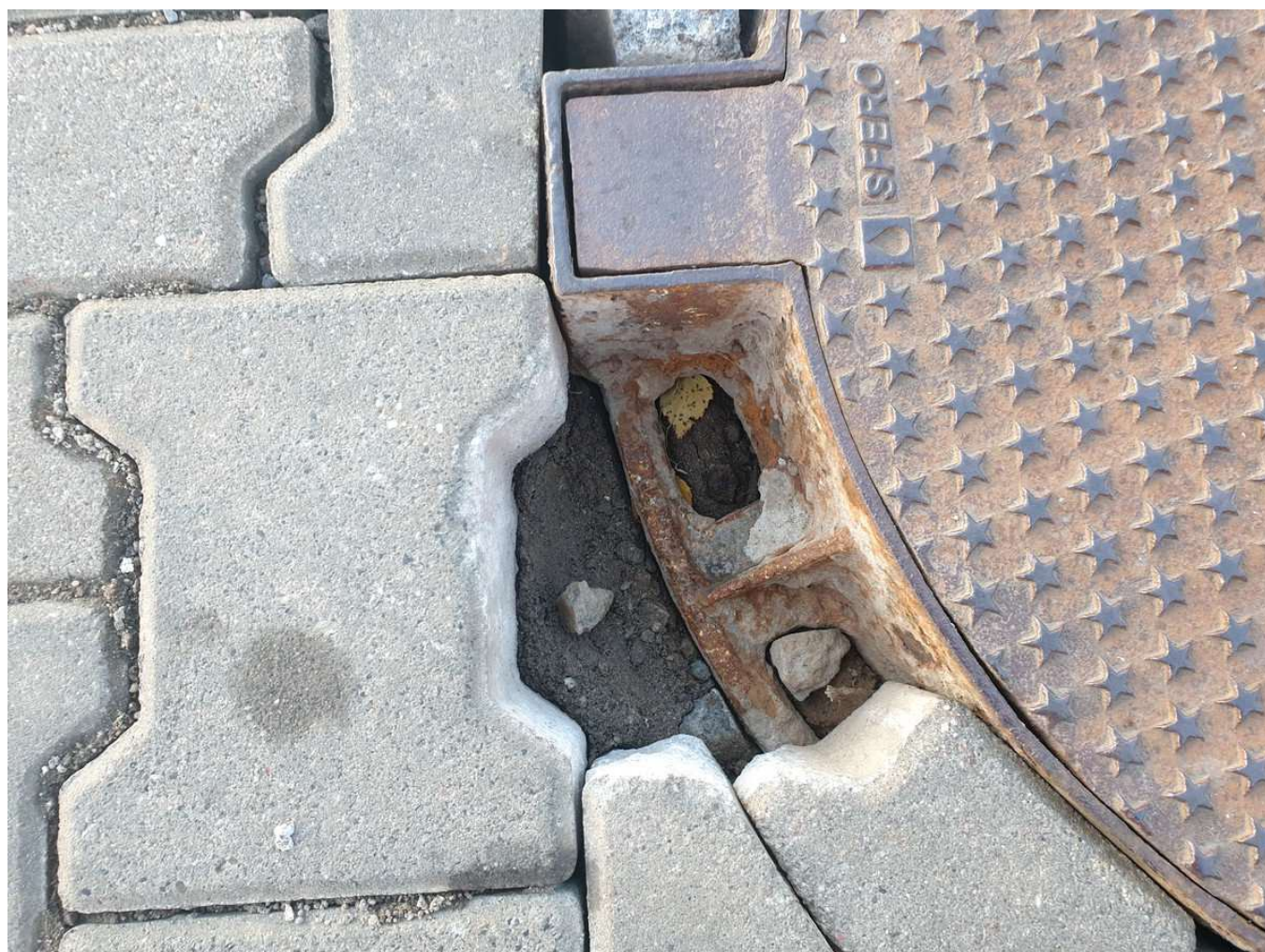
— Klapa_Legnicka_34.jpg —